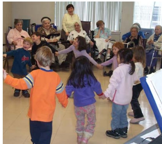
Un programme intergénérationnel a eu lieu en janvier avec la chorale des résidents. Des enfants d'une garderie locale ont chanté avec la chorale et rencontré les résidents.

► Nous avons recruté 38 nouveaux bénévoles depuis novembre et notre campagne se poursuit à ce jour.