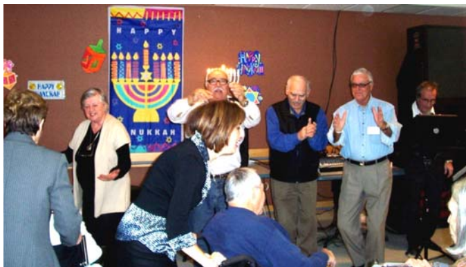
La Communauté Sépharade Unifiée du Québec a commandité un dîner de célébration d'hannukah à l'intention de nos résidents dans les deux pavillons.