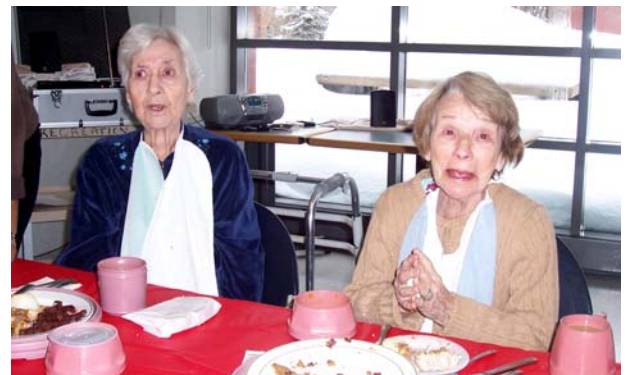
Les résidents non juifs des deux pavillons ont été conviés à un dîner de Noël.