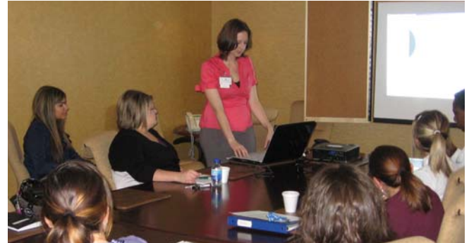
Une stagiaire en diététique informe le personnel des bienfaits du programme d'assistance alimentaire.