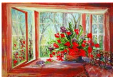
Flowers at my Window, Birdie Hyatt-Akerman (2008)

La Fondation de l'art pour la guérison , qui consacre son temps à promouvoir les effets bénéfiques de l'art aux hospices, aux hôpitaux, dans les refuges et les centres, a fait le don de l'oeuvre d'art représentée sur la couverture de cette carte.